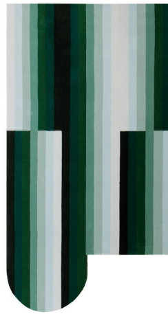
RB 05 Evergreen