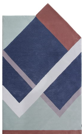
RB 01 Line Up