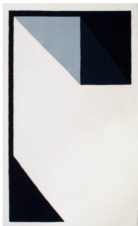
RB 03 Cabine