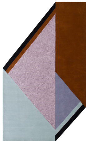
RB 02 Trofeo

I dati forniti in questa scheda tecnica sono aggiornati al momento della pubblicazione. Carpet Edition si riserva il diritto di modificare materiali, dimensioni e caratteristiche senza preavviso. The data provided in these technical specifications are up to date at the time of publication. Carpet Edition reserves the right to modify materials, sizes and characteristics without notice.